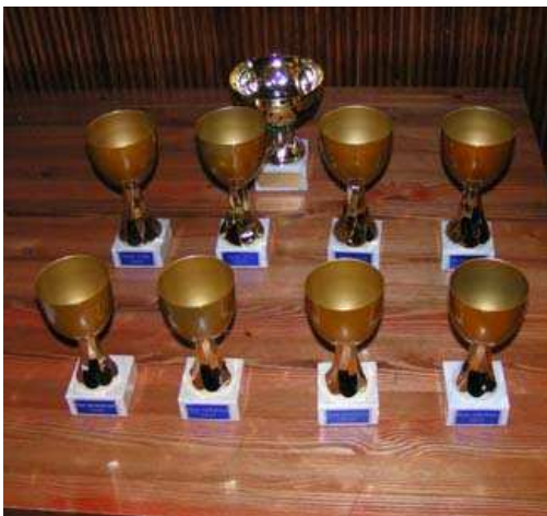
Etualalla kuuluisat R'lyehin maljat.

Ensi vuonna on aihetta kunnon juhlaan. Erun taipaleen alusta tulee nimittäin kuluneeksi neljännesvuosisata. Vanahan tyyliin gaala muodostunee ravintolapäivällisestä sekä gaalajuhlasta, jossa jaetaan kuuluisat R'lyehin maljat. Palkintoja jaetaan useissa eri kategorioissa aina parhaista larpeista elämäntyöpalkintoihin.