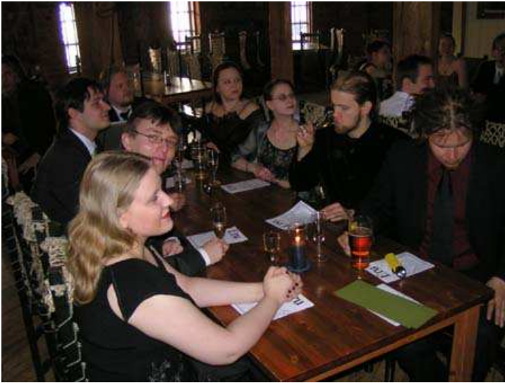
Erun 20-vuotisgaala järjestettiin maineikkaalla kult- tuuriravintola Telakalla vuonna 2005.

Palkintojenjakoseremonian päätyttyä siirryttiin juhlapäivälliselle. Herkkupöytä oli ka- tettuna Näsinneulan ravintolassa, joka oli varattu yksityiskäyttöömme koko illaksi.