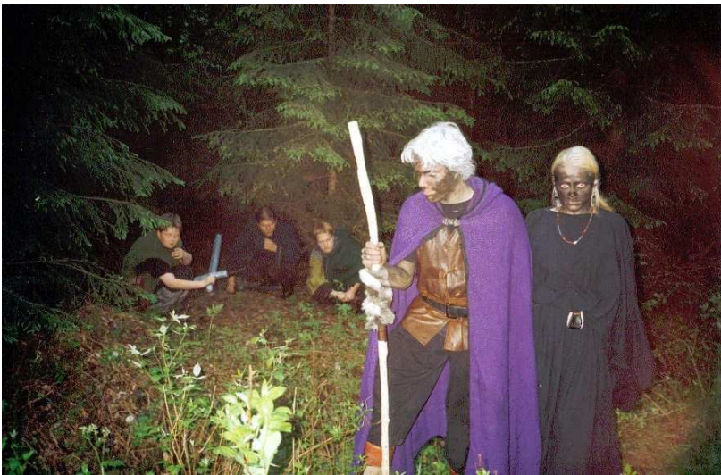
Kottinoro-peleissä on aina tiivis tunnelma.

2000-luvun alussa kaikki oli hyvin. Jämsä oli elämäni keskipiste. Oli kaverit ympärillä ja maailma, näin laajemminkin ajateltuna, tuntui kohtalaisen hyvältä paikalta elää. Meitä oli pari keskenkasvuista poikaa, joita kiinnosti roolipelit ja larpit. Kai osittain siksi, että vanhemmat eivät viitsineet kuskata meitä pitkin Suomea joka kuukausi, alettiin valmistella omia pieniä pelejä jo aivan muutamien pelikokemusten jälkeen. Pelinjohtajana toimiminen tuntui arvokkaalta tehtävältä, josta sai kiitosta ja kunnioitusta riittävästi. Tai ainakin niin paljon, että uuden idean saadessa otti puhelun kaverille ja polki fillarilla tämän luokse. Tuntui ettei silloin ollut muuta tekemistä iltaisin, joten yleensä riitti kun meni kylään ja aloitti suunnittelun.