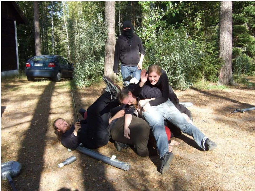
Myly eli kasa mallia 2009. Lajina Trejämsäläinen infrapesäpallo.

Sesongin päätösjuhlallisuudet sijoittuvat puolestaan Seitsemisen kansallispuistoon Ylisenlammen mökille. Täällä on vuosikymmenten mittaan järjestetty monet unohtu-mattomat pelit ja tapahtumat. Paikka oli pääosin entisensä vaikkakin se olikin laajalti remontoitu. Meno oli heti entisen kaltaista eli sangen vauhdikasta. Olivat mokomat menneet kuitenkin vaihtamaan saunaan uuden kiukaan. Asiantunteva raatimme arvioi sen aivan liian pieneksi. Erityisesti illan ohjelma jäi mieleen ensiapukurssi sekä san-kari-antisankari arvausnäytelmä. Porukka pisti taas parastaan. Ihmeellistä oli yli puo-len juhlaväen kömpiminen nukkumaan jo puolenyön kieppeillä. Kyllä työelämän kii-vas tahti imee vaan porukasta mehut.