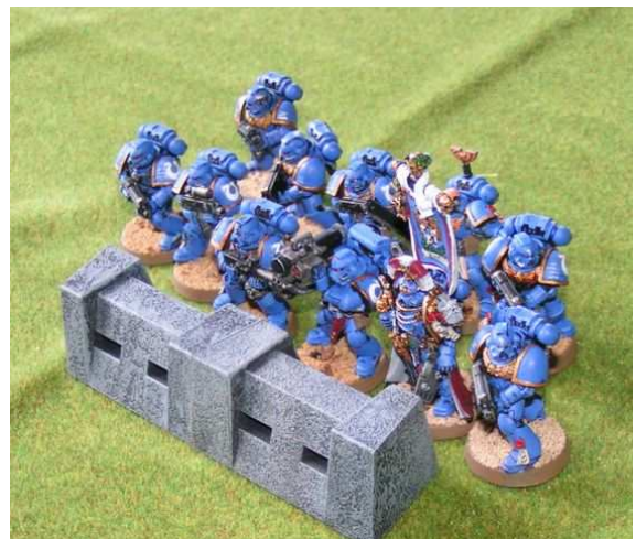
Pian taas kajahtaa: "Ultramariinit - voittoon Keisarin puolesta!"

Nopan historia ulottuu suosituksen mukaan Intiaan yli 5 000 vuoden taakse. Noppa valmistettiin alunperin luusta. Tähän käytettiin todennäköisesti rystysiä, jotka muistuttavat muodoltaan nelitahoista tetrahedronia. Intiasta noppa levisi Persian kautta ja nelitahoista nopasta on mainintoja myös raamatussa, erityisesti kuningas Davidin ajalta noin 1000 vuotta eKr. Roomalaiset, jotka olivat intohimoisia uhkapelaajia,