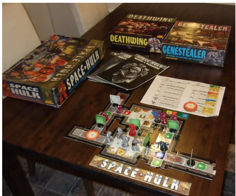
Space Hulk - ensimmäinen laitos kaikkine lisäosineen.

Koska ne ovat niin tärkeitä ja hyvin vaarallisia kohteita jää niiden tutkiminen ja vastarinnan murtaminen space mariinien eliittijoukkojen terminaattorien harteille. Terminaattoriryhmä pyrkii hulkin pimeillä käytävillä suorittamaan kulloisenkin tehtävänsä ja samalla taistelevat ylivoimaista muukalaisjoukkoa vastaan.