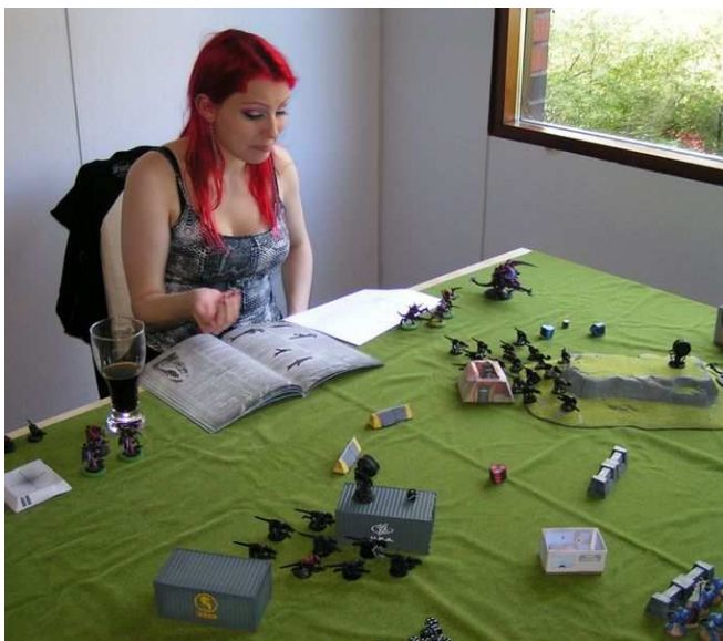
Nenne kehittelee ovelaa rynnäkkösuunnitelmaa hirmuisille Tyranideille.

Pitkän tauon jälkeen seuran taistelukentillä kohtaavat taas pienistä ukoista koostuvat armeijat verisissä kamppailuissa, missä vankeja ei oteta ja armoa ei tunneta. Mistä oikein on kysymys? Games Workshopin Warhammer 40 000 miniatyyripeli on vuosikymmenen tauon jälkeen ottanut vakiintuneen paikan seuran lautapelien joukosta. Monen hiljaiselossa vietetyn vuoden jälkeen yllättävän moni osoitti kiinnostusta 40k:n pelaamiseen, kun asiasta virisi keskustelu foorumilla. Muutamalla oli armeijat, tai sellaisen alku olemassa, mutta suurin osa aloitti puhtaalta pöydältä. Oli oikeastaan yllättävääkin kuinka nopeasti homma lähti uudestaan pyörimään.