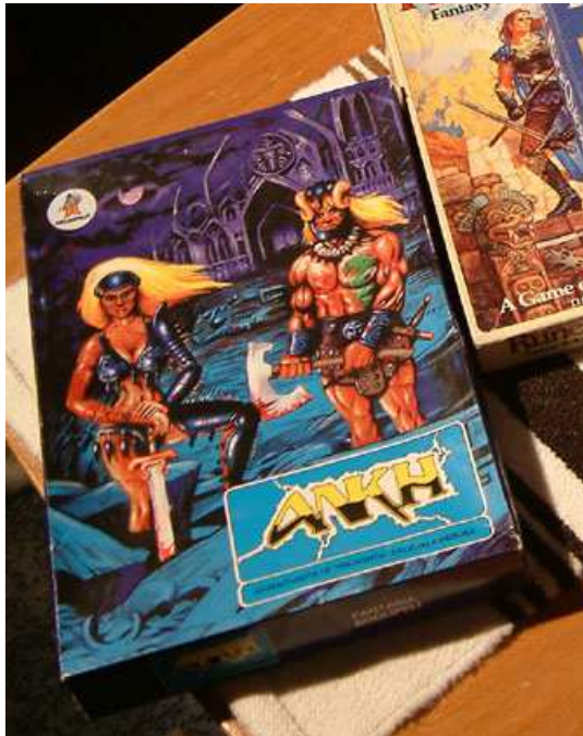
Ankh löytyy myös Erun jäsenten ilmaiseksi käytössä olevasta varastosta.

Ankh on hivenen D&D vaikutteinen, näin olen kuullut. Paino sanalla kuullut, sillä kuulun siihen todella harvinaiseen roolipelaaja porukkaan, joka ei koskaan ole D&D:tä pelannut. Joku lukijoista ryntää varmasti pian tämän jälkeen korjaamaan tämän puutteen. Ankh on esikuvansa kaltainen siinä mielessä, että sen avulla roolipelien alkeet on todella helppo oppia ja opetella. Ikäväkseni olen myös huomannut, että jotkut roolipelaajat pitävät tätä peliä floppina. Tämä on toki mielipidekysymys, josta voidaan keskustella sekä kiistellä hamaan tulevaisuuteen saakka.