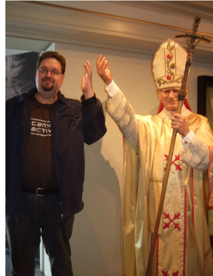
Päätoimittaja jättää jäähyväiset arvovaltaisessa seurassa.