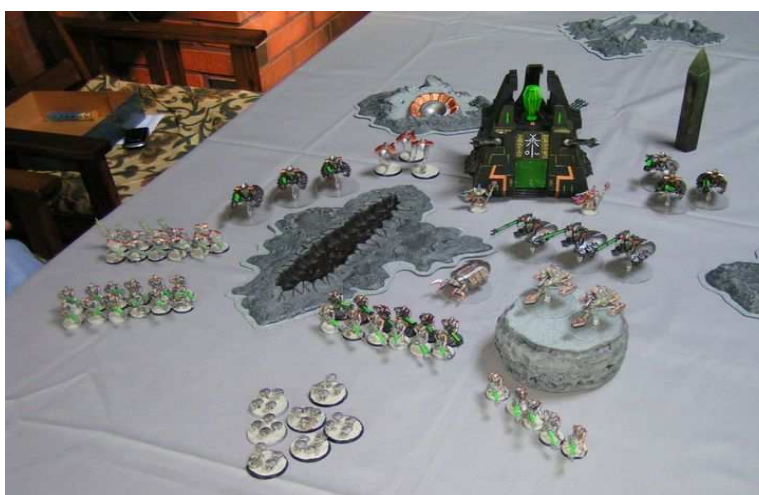
Necronarmeijan yksi suosion syy on helppo maalattavuus. Etualalla oikealla savikupista konvertoitu mäki.

Kukin tyyllillään, mutta pensselin varressa roikkuminen on kuitenkin erottamaton osa harrastusta. Mikään ei näy-