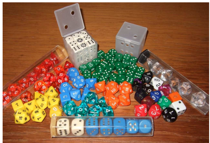
Päätoimittajan noppakokoelma on melko suppea moneen roolipelaajaan verrattuna.

D&D:lle kuuluneet kunnia myös noppiin liittyvän esitysmuodon helpottamisesta. Aikaisemmin, kuten ilmenee vuoden 1974 D&D Blue Box -painoksessa 8-tahoisen nopan heittämistä kerran merkittiin ”1-8” ja saman nopan heittämistä kaksi kertaa: ”2-16”. Nämä esimerkit olivat yksinkertaisia ja oli helposti pääteltävissä, mitä nopan heittoa kyseinen merkintä tarkoittaa. Mikäli heitettyyn lukuun haluttiin lisätä vielä pari pistettä, heitettävä noppa ja heittojen lukumäärä sekä siihen lisättävä summa merkittiin edelleen edellä mainitulla tavalla. Kaikki mahdolliset tulokset merkittiin lukujonona, jolloin esimerkiksi kaksi kertaa nelitahoisella nopalla heitetty tulos lisättynä yhdellä, merkitään ”3-9”. Tällaisten lukujen esiintyessä roolipelin aikana, saattoi toisinaan peli harrautua matemaattisen yhtälön ratkaisemisen puolelle. Mitä noppaa heitetään ja kuinka monta kertaa, ja lisätäänkö päälle ehkä piste tai pari, jos vastaan tulevat merkinnät: ”8-26” tai ”4-66”? Matemaattisten yhtälöiden ratkaiseminen kyllä saattaa olla älykölle mukavaa ajanvietettä, Onneksi nuo ajat ovat takana ja pelaaminen onnistuu ilman algebraan liittyviä väittelyitä pelin lomassa.