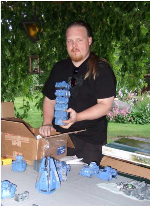
Meillä ei lähde mopo puheenjohtajan käsistä. Pikemminkin kysymykseen tulevat pienehköt panssarivaunut.

Ensi vuonna koittaa muuten seuran 25-vuotispippalot. Neljännesvuosisataa juhlistamaan on luvassa suurgaala, johon on rahallisesti panostettu taas viiden vuoden ajan. Mielenkiinnolla jään odottamaan mitä omituisuuksia gaalatoimikunta saa tällä kertaa päähänsä. Vaikka aikaa juhlallisuuksiin on vielä rutkasti niin valmistelut rullaavat jo täydellä teholla. Nyt syksyn ja talven aikana vapaaehtoisia kaivataan useisiin eri tehtäviin. Moista juhlaa pääsee järjestämään harvoin, joten lähtekäähän kaikki mukaan. Kesällä 2010 sitten kajahtaa!