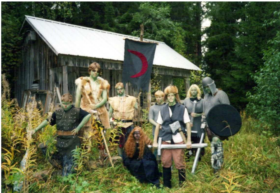
Örkkiryhmä Kottinoron mailla.

Erun alkuajat olivat parasta aikaa luovuuden kannalta. Oli erittäin hienoa saada tutustua paikkakunnalle muuttaneeseen seuran puheenjohtajaan puolisoineen. Tätä kautta Kottinoro-pelit laajenivat koko Erun käsittäviksi kutsupeleiksi. Samalla olin mukana kirjoittamassa muutamaa muutakin Erun peliä. Kannustava ja rakentava palaute kokeneilta kirjoittajilta tuntui hienolta ja erittäin palkitsevalta.